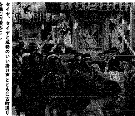
セイヤ、セイヤと威勢のいい掛け声とともに古町通りを進む万燈籠みこし

三千五百人の威勢のいい掛け声が周りを熱気に包んだ市民みこし。かわいいうらみこしが印象的だったまつり行列。二万六千人の踊り手が万代橋やメインストリートを埋めた大民謡流し。そしてスターマインが美しかった花火大会も。新潟まつりは大気にも恵まれ、例年以上の盛り上がりみこしをみせ、三日間で七十三万人の人出がありました。