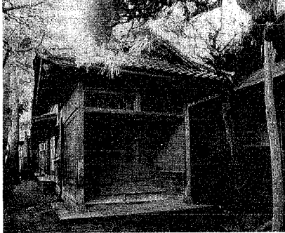
再建される旧齋藤邸の式台 (玄関) ~解体保管前に撮影

試験日 (二次) 九月二十四日 試験会場 市立沼垂高校 試験内容 (一次) 市職員 (一般事務) と消防局職員 (一般事務) と消防局職員 (筆記試験) (教養) と適性検査、そのほかの職種は筆記試験 (教養・専門) と適性検査