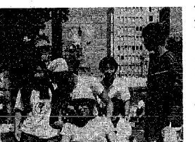
小さな殺意もたいへん→車いすで街を点検

市民の意見を 8月24日に 新潟交通物からバス運賃の変更申請を行うとの通知がありましたので、市では「市民の意見を聴く会」を開催し、十八(応募多数の場合抽選)名を申し込みます。 申し込み 八月二十七日から十一日までで電話で消費生活センター(☎内線2412番)へ(※傍聴希望者も申し込みください)。 なお、変更理由は①自家用車の増加と、週休二日制による利用者の減少の都市部の交通渋滞による輸送効