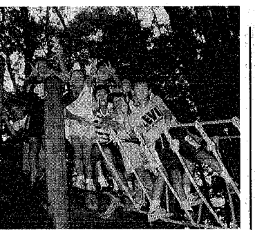
夏休みは野外活動もいっぱい

西地区公民館 (☎261-0034) 夏休み子ども映画会 日時 七月二十八日 午前十時～正午 内容 インディア・アスレチック大会、集団ゲーム 申し込み 当日直接会場へ 対象 小学生と親先着二十人 参加費 一人五百円 申し込み 七月二十八日 午前十時～正午 会場 西地区公民館