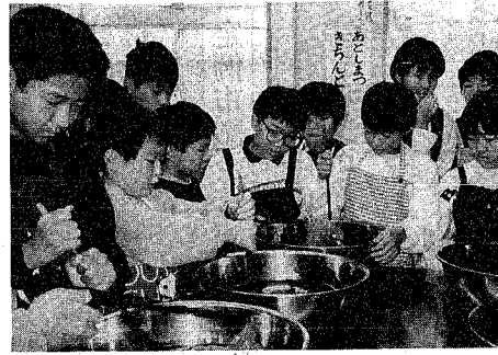
草木染めのハンカチ作り～昨年の自然体験活動から

子どもたちの豊かな人間性の育成を目指し、市では子どもたちに提供しているさまざまな学習・体験の場に加え、今年度は新たな造形活動として、この「ちびっこ芸術家」を創設することにより、子どもの創造性をはぐくむという目的で、成長発達に欠かせないもの。成長発達に欠かせないもの。