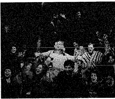
殿様ガエルのプリンと小動物との出会いを描く物語

市では、震度六の直下型地震を想定した震災訓練を、六月十六日に実施しました。 訓練は、市内二十四カ所で災害が同時に発生したという設定で行われ、消防局、自治会、小・中学校などが参加しました。当日は消火栓が使用不能になったという想定で、信濃川から消防艇で水をくみ上げ、中継車で送水する訓練など新しい試みも行われました。