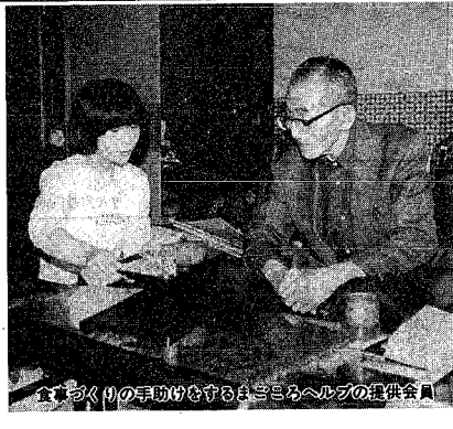
食の支え手としてのヘルプの提供員

市開発公社では、コープラティブ住宅「コープタウン松和」の計画を進めています。コープラティブ住宅とは、建築条件付き宅地分譲の一種で、家を建てたい人たちが集まりみんなで住宅づくりを進めるものです。建設予定地は、松和町の中区コミュニティセンターわきの高台で、じゅんさい池公園などに近く、緑豊かな環境の実現を目指します。 コープラティブ住宅は、地域コミュニティの必要性が高まる中、住宅づくりから住む人が交流を深め、快適な居住環境の実現を目指すものです。また、共同発