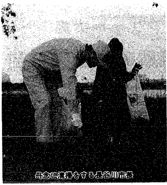
鳥屋野潟をきれいにする鳥屋川市民会

五月十四日、鳥屋野潟周 辺で一斉清掃が行われまし た。この清掃は近隣の自治 体と協力して、毎年春と秋の 二回実施しているもの。今