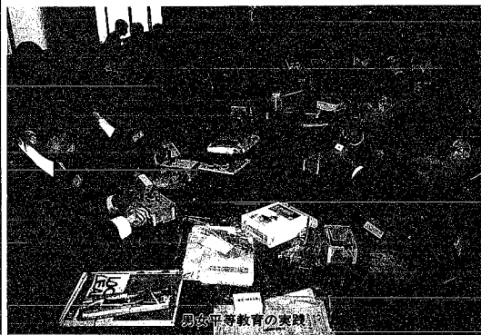
男女平等教育の実現