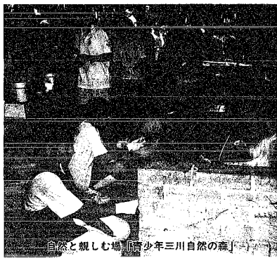
自然と親しむ場(青少年三川自然の森)