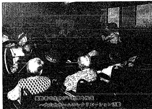
高齢者の生きがいの創出推進 ～赤山台ホームのレクリエーション活動～