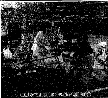
積極的に資源回収に取り組み神明自治会

これは、市が三月に設置した観光路面誘導板です。今回は新潟県から万代橋までの東大通りと万代橋通りの歩道八ヶ所を設置。歩行者を観光スポットに誘導するとともに、まちを歩きたい人から楽しんでもらうと企