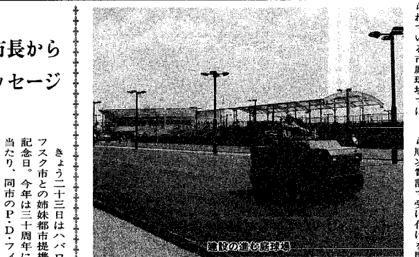
建設中の新市民球場