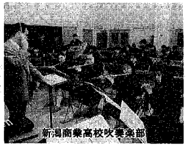
新潟商業高校吹奏楽部

八月四日から八日まで、県内八市町村で全国高等学校総合文化祭新潟大会が開催されます。これは、文化のインターハイとも呼ばれる若人の祭典で、全国の高校生約一万人七千人が参加し、二十部門で芸術文化活動の発表を行います。本市では、バレエ・総合開会式・吹奏楽・日本音楽・書道・写真・囲碁の七部門と協賛開催の華道・茶道部門の発表が県民会館や市美術館などを会場に行われ、交流が深められます。 昨年の愛媛大会に県代表として参加した新潟商業高校で(土・日曜を除く)時間 午前八時半～午後五時十五分 場所 資産税課(市役所本館二階) 縦覧できる人 ①所有者とその同居の家族の代理人 ③納税管理者 ④法人・所有者の委任状 ⑤法人の社員・社員のある者と同居の家族、納税管理者 ⑥前年度の納税通知書や運転免許証の納税通知書 縦覧期間 四月二十四日まで