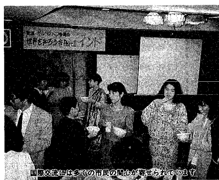
国際交流には多くの市民の関心が寄せられています