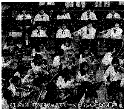
演奏を披露する市ジュニアオーケストラ教室の受講生

音楽文化会館が主催する、ジュニアオーケストラ教室とジュニア合唱団の受講生を募集します。受講生たちは音楽を通じた仲間づくりに、またより高いレベルでの音楽活動を目指し、毎週活動を行っています。どうぞご参加ください。 会場 音楽文化会館 問い合わせ 同館(☎2241581)へ