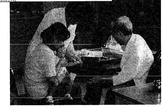
予防接種を受ける子どもと保護者の義務接種から努力接種に

東保健所保健予防課 ☎243-5311 西保健所保健予防課 ☎266-5171 保健衛生課 ☎228-1000