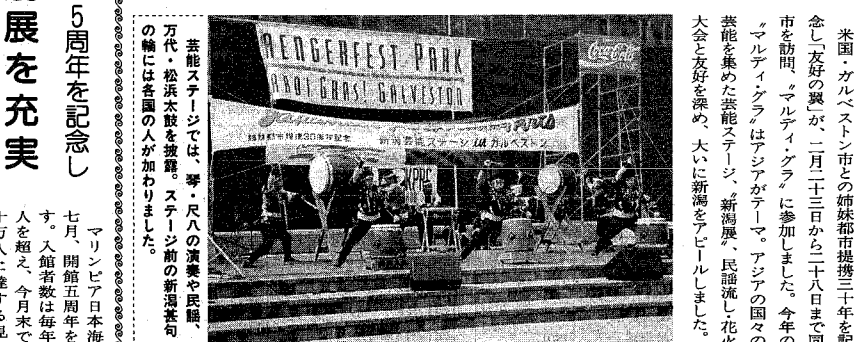
去能ステージでは、琴・尺八の演奏や民謡、万代・松浜水鼓を披露。ステージ前の新潟舞句の輪には各の人が加わりました。

米田・ガルベストン市との姉妹都市提携三十年を記念し「友好の翼」が、二月二十日から二十八日まで同市を訪問。マルディ・グラに参加しました。今年、マルディ・グラはアジアがテーマ。アジアの国々の芸能を集めた去能ステージ、新潟展、民謡流し、花火大会と友好を深め、大いに新潟をアピールしました。