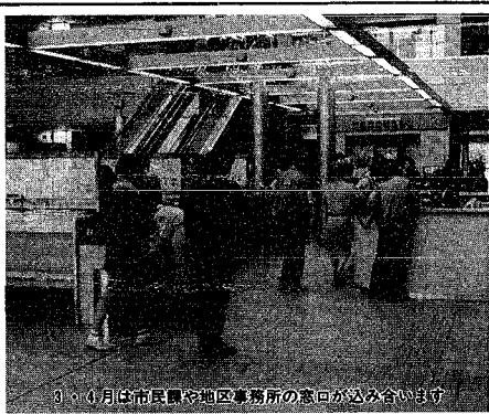
3、4月は市民課や地区事務所の窓口が込み合います

三月下旬から四月上旬 各種証明書の交付申請は、入学、就職、転勤、転退のため市民課や地区事務所などに押す住民異動届やなどの窓口が大変混雑します。