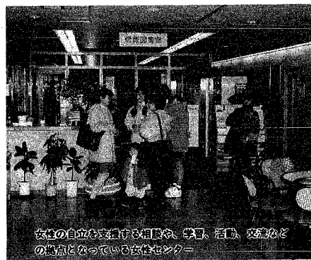
女性の自立を支援する相談や、学習、活動、交流など の拠点となっている女性センター

悩みはだれにでもあつても 気軽にどうぞ 一般相談 一般相談は、悩みや心配 ごとについてカウンセリン グなどを行つていきます。 ここでは性別や年齢に関係な く、さまざまな心の悩みを 相談にのっています。相談 員が女性という点もあ り、女性の相談が中心と なっていますが、平成五年 度の内容をみると、述 べ相談件数は三百八十五 件、そのうち男性の相談は 述べ四十件ありました。 相談内容は自分の生き 方、夫婦、家族、男女の間 の公演を行います。