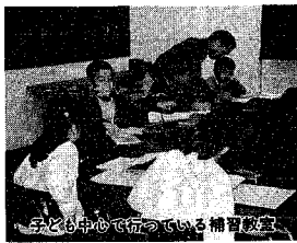
子どもも中心で活動している補習教室

シルバー人材センターでは、退職した教員経験者たちが中心となつて、補習教室を開催しています。