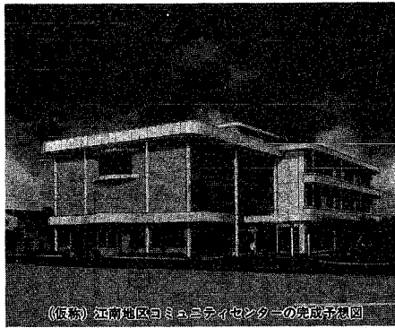
《仮称》江南地区コミュニティセンターの完成予想図

住民の自主的な地域活動の場を整備しようと、市ではコミュニティセンターの建設を計画的に進めています。このたび、そのひとつ(仮称)江南地区コミュニティセンターの工事が、十二月の完成に向け本格的に始まります。