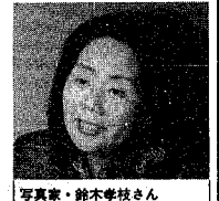
写真家・鈴木孝枝さん 日本写真協会会員、新潟日報刊「つと、と、ぬくもり」で写真を担当