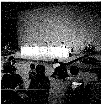
昨年10月、市民プラザで開かれた「百人集會」

市芸術文化振興財団では「文化を語る百人集會」を、文化に親しむ多くの市民から、本市の文化の発展のために貴重な意見や提言をいただくことを目的として、今年度、新たに親しむ多くの文化を語る百人集會を開催します。この文化の発展のためには、市民の意見や提言を積極的に受けとることが重要です。今年度は、市民の文化の発展のために、文化に親しむ多くの市民から、本市の文化の発展のために貴重な意見や提言をいただくことを目的として、今年度、新たに親しむ多くの文化を語る百人集會を開催します。