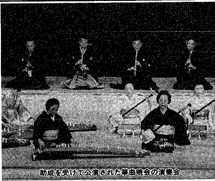
助成を受けて公演された新曲映画の演奏会

市芸術文化振興財団が、開始してから、今年で五年、平成三年十二月に、「市民目を迎えます。この助成を、文化活動や文化鑑賞の芸術文化活動」に助成を、