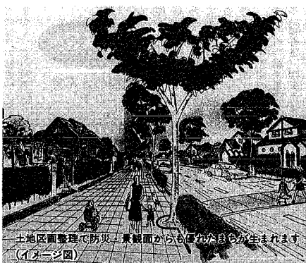
土地区画整理で防災・景観面からも暮らしが生まれやすくなります(イメージ図)