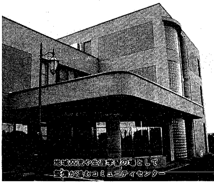
生涯学習センター(仮)として 建設中のコミュニティセンター

今年九月に行った市政世論調査の結果から、二回目の今回は「生涯学習」「広報活動」「行政施策の優先度」について紹介します。 問 生涯学習の経験の有無と内容について 「ある」と答えた人は五四・七割、「ない」は四三・一割で内容については趣味的なものが五七・二割と最も多く、次いで「スター」の順になっています。