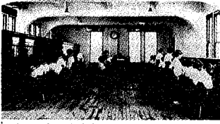
大正15年の交換室 「新潟の電話七十年のあゆみ」から

設置できず、電話のない役場も多かった。大正五(一九二六)年に那根所が廃止になると、政府は、県との連絡用に町村役場の電話を置くことを勧めた。石山村は、この時電話を引いた。電話番号は二七七二。昭和二年(一九二七)十一月一日、