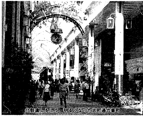
化粧直直として、明るくなった古町通交番町

なげなく歩いていける街並がよっと明るくなって来たと思いませんか。市では魅力と活気のある商店街づくりを支援しようとして、商店街の顔であるアーケードの改修やカラー舗装工事などを行う商店街に対して助成を行っている。この制度は商店街環境整備事業として昭和五十四年から実施しているもので、補助率は整備総額の三〇％、アーケード改修の場合は千五百万円が限度額となっており、本年度は当初の十四件の整備要望があり、十八組合・二十一件の申請が出されています。商工振興課では「アーケードの老朽化にとまらぬ架け替え時期がきていた事や、大型店のオープンが刺激となつたのでは」とみています。 明るく生まれ変わった街並みは市民体のイメージアップにもなつていくのでは無いでしょうか。補助率を二利用を