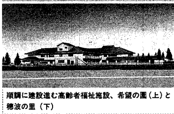
順調に建設進む高齢者福祉施設、希望の園(上)と種波の里(下)