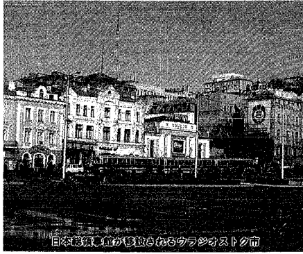
日本総領事館が移設されるウラジオストク市

ロシア総領事館の新潟市への設置がこの十三日に正式に決定しました。これは、ロシアのエルツィン大統領が来日の際、外相レベルで交換した日ロ合意十六文書の中を明らかにされたもので、市は環日本海の拠点都市としてさらなる一歩を踏み出すこととなります。 ロシア総領事館の設置は、日本では大阪、札幌に続き三番目で、市にとって、旅行者にとっても、今まで東京まで取りに行っていた