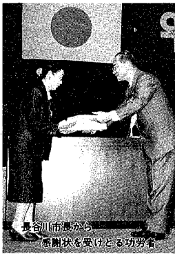
長谷川市長から感謝状を受け取る功労者

交通安全事故ゼロの日を記念して、十月十六日市民プラザで交通安全功労者感謝状贈呈式が行われました。これは、長年にわたる地域や職場、交通安全指導などを行い、交通安全事故防止に貢献した人や団体の労をねぎらおうというもので、今年も個人十人と九団体に贈られました。