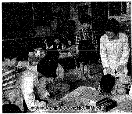
生き生きと働きたい女性の手助けに