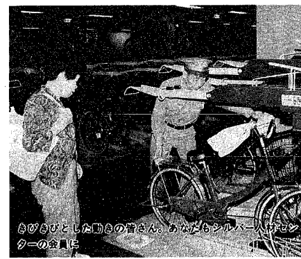
あなただけの活動の皆さん、あなただけのシルバーの会員は

市では、し尿と生活雑排水の両方を併せて処理する合併処理浄化槽の設置費用の一部を補助する制度を設けています。合併処理浄化槽の処理能力は従来よりも八倍も強力で、下水処理場と同じくろ過水をきれいにできます。 公共下水道が整備されていない地域では、ふるや洗濯、台所などの生活雑排水によって、河川の汚濁が進んでいます。これから浄化槽を設置する場合はこの制度を利用し、河川の汚濁防止にご協力ください。