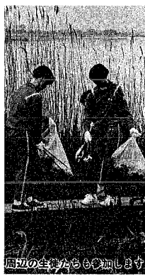
周辺の清掃にも参加します

と力を合わせ、きれいな鳥屋野湯を守ろうと一斉清掃を実施しています。春は、約千人が参加して四、五の清掃を行いました。今秋は十月十七日に行います。家族、友だちと一緒に参加してください。 日時 十月十七日午前九時～十時半(雨天中止) 集合場所 湖東の宿 湖前広場