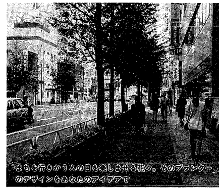
さまざまな人の目を惹きつける花々。そのプランターのデザインをあなたのアイデアで

ウラジオストク港のロプカノフ港長一行が、昨年ウラジオストク・新潟の姉妹港締結を記念した行事