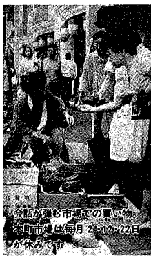
本町の中心部を歩く人々。毎月20日・22日の本町市見物会が盛況です。

安さと成勢のよさを競い、新潟の台所の一角を担っている市場。本紙では主な市場を紹介していきます。 市場と聞くとまず思い浮かべるのが、本町通り五・六番町の本町市場。皆さん 一度は訪れたことがあるのでは、五番町は昔ながらの中心部という恵まれた立地から、昼休みや仕事帰りに買い物客でにぎわっている人も多くいます。それに観光案内で必ず紹介されている本町市場の特色です。 野菜売りのおぢいちゃん、おばあちゃん、お客さんとのやりとりが楽しみな、うれしいうちやっぱ売れた時です」と話してくれました。