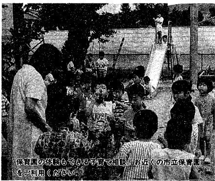
保育園の体験もできる子育て相談。お近くの市立保育園をご利用ください。