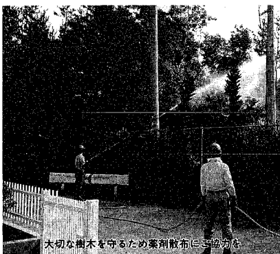
大切な樹木を守るため薬剤散布に協力

持ち家を手に入れるための新しい手法として、最近注目されているコープ住宅(コウピング・コープ住宅)の家を持ちたい人が集まって、共同で土地を購入し、設計・工事の発注を行うコープ住宅は、次のような特徴を備えています。①豊富な環境：一人ではできない共同施設(集会施設、共同庭園、駐車場など)や活動の場をみんなでつくり出し、豊かな環境をつくり出せる。②良好なコミュニティ：共同の住まいづくりに進める中で、入居前などから親しい人間関係が育ま