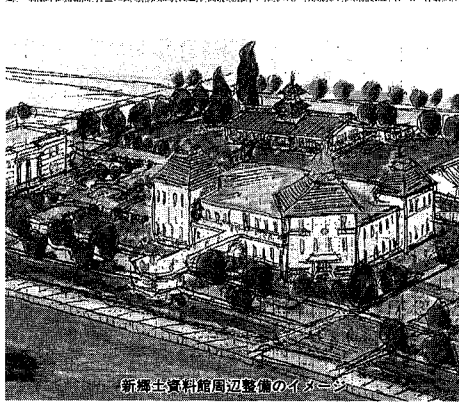
新郷土資料館周辺整備のイメージ

市では、郷土資料館周辺地区を信濃川と調和のとれた歴史・文化地区として整備しようとする。その中核となる新郷土資料館の建設を中心に、今年度から基本計画の策定に取りかかります。 現郷土資料館は、明治二