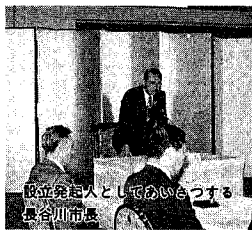
設立発起人としてお話を伺う市長

介する場として十分とはいえない状態です。このため再見しようとする。旧信濃川や荷揚げ場、堀、柳、木橋など、新郷土資料館への期待は高まってきています。そこで、新郷土資料館の建設とともに、歴史・文化地区として周辺地区を整備する構想をまとめた。 港町を再現 情勢豊かな