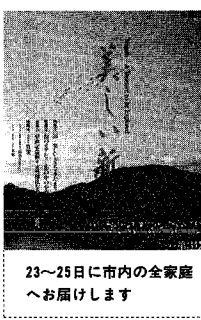
23~25日に市内の全家庭へお届けします

税証明書は、市民税課および地区事務所で行われます。平成4年分の所得証明書は、課税額が決定する六月十六日から発行となります。ただし、給与所得者で、市民税を給与から毎月差し引かれる特別徴収で納税している人は、五月十二日から発行問い合わせ、市民税課(市内2327番、地区事務所)へお申し込みください。