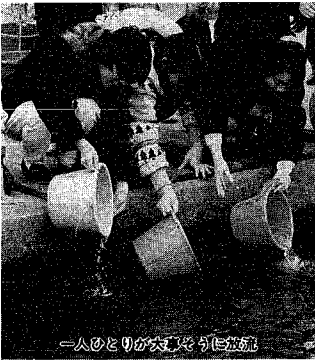
一人のとりが穴をさぐり放流

「またここに帰って来るんだよ、わかったか?」大きくなっておいで。子どもたちの持つバケツから、次々と信濃川へ泳ぎ出すサケ