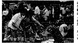
日本海夕日クルージング スワップナイト

元気印ビジョン21 ネットワーク大学 若者の立場で三十年後の新潟を考えよう、昨年からの始めた新企画。新潟が大好きというあなた、ぜひご参加ください。ネットワーク通信編集