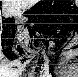
物産展会場のステージで行われた長さ20mの巻き舞子「百歳長寿巻き」