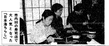
市内90の寿司店で大人気となった「日本海ちらし」