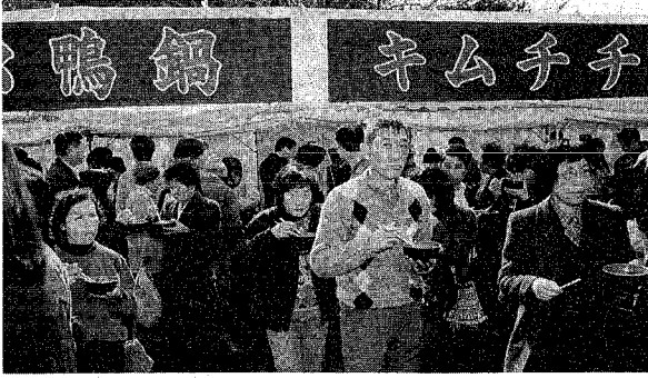
5種類の鍋料理で体はホカホカ

新潟の冬にかつてない規模の初のイベント「にいがた冬の陣」が、二月一日から七日の週間座、六七日の当日座と、彩り豊かに行われました。中でも当日座では、会場の市体育館周辺に二日間で、約七万人を市内外から集客。鍋料理には長い行列ができ、中には食ながら次の鍋に並ぶ人もいて、あたりは湯気と香りであらびに。旗まつりや氷の彫刻、雪あそびコーナーとともに、新しい新潟の冬の情景をつくり出しました。また週間座では、市内の料亭割烹で新潟芸妓(ぎ)の舞旅館でナンペンエビと地酒サビビスなどがあり、寿司店では日本海ちらしが大好評。まちじゅうが冬の、真で一色に染まっていたように。