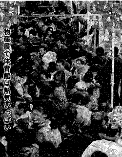
物産展で縁起物(おまけ)

新潟の冬にかつてない規模の初のイベント「にいがた冬の陣」が、二月一日から七日の週間座、六七日の当日座と、彩り豊かに行われました。中でも当日座では、会場の市体育館周辺に二日間で、約七万人を市内外から集客。鍋料理には長い行列ができ、中には食ながら次の鍋に並ぶ人もいて、あたりは湯気と香りであらびに。旗まつりや氷の彫刻、雪あそびコーナーとともに、新しい新潟の冬の情景をつくり出しました。また週間座では、市内の料亭割烹で新潟芸妓(ぎ)の舞旅館でナンペンエビと地酒サビビスなどがあり、寿司店では日本海ちらしが大好評。まちじゅうが冬の、真で一色に染まっていたように。