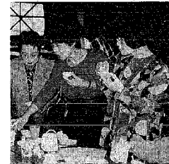
ヨーグルトの試買調査をするレポーター

固定資産税 台帳縦覧は 3月1日から 縦覧とは、固定資産課税台帳に登録された固定資産の状況や、課税の基となる評価額など、を納税義務者にあらかじめ公開し確認してもらう制度です。期間などについては次のとおりです。 縦覧期間 三月一日(土曜)～三月二十二日(土曜)(日曜を除く) 場所 資産税課(本館) 課税課(分館) ※納税通知書の発送は四月中旬の手定です。