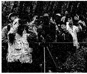
市民生活と市政には密接なつながりが—— 水と緑豊かな西海岸公園(上)と寺尾中央公園