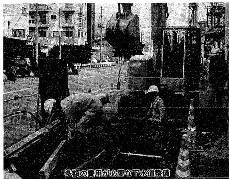
多額の費用が必要で下水道整備

がた旗まつりを開催します。東内各地から百十一点もの応募があり、米や魚など新潟の旗のデザインを募集し、今月十一日に審査の上入賞作品を決定。