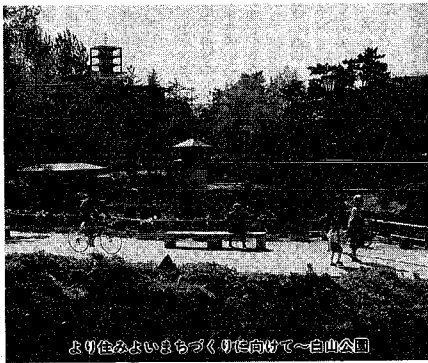
よりいよいよお祭り気分に向けて～白山公園

市民の皆さんの市政への信頼性を高め、いく新しい制度・新潟市行政評価委員会が2月1日からスタートします。これは、皆さんが市に寄せた苦情に対する市の処理について、なお不満だという再度の申し立てに基づき、委員会が公正・中立の立場で調査、市に開示があればそれを正しく直すように、申立人に代わり市に対して意見を述べる制度です。