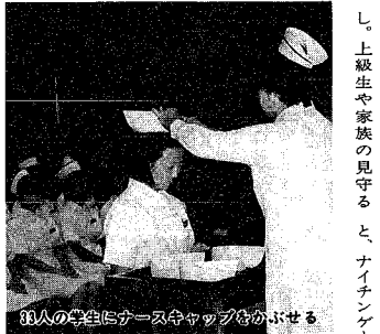
38人の学生にカースキヤップをかぶせる

今年の四月、看護婦を目指し、市立看護専門学校に入学した一年生三十三人が八月の予科期間を終え、看護婦として