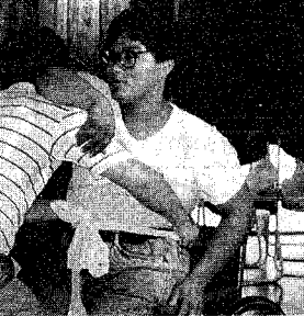
車いすの介助訓練を体験～夏に学生を対象に行われたボランティア体験学習

教育改革モニターを募集 期間 2年 対象 20歳以上10人(議員、教員以外の公務員、行政相談員を除く) 内容 文部省から依頼するテーマについて意見を提出 申し込み 1月14日までに県教育庁総務課(☎285-5511)へ