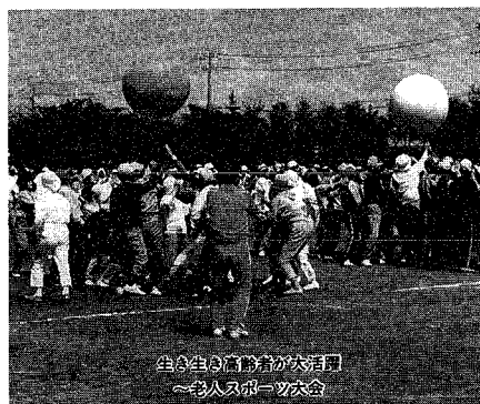
生活者の活動が活発 ～老人スポーツ大会

風しん抗体価検査 日時 12月8日午前9時～3時半受付 会場 東保健所 料 800円 対象 18歳以上の女性(妊婦を除く) 申し込み 電話で会場へ(予約制)