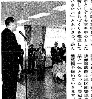
上、長川市長は「日本海を軸に、同大学は情報文化学部、内には情報文化学部(定員百五十名)、情報文化学部(定員百五十名)の二学科が設置される予定。市では今後赤塚駅前地区の整理整備を一体的に推進していきま

月十一日、建設地の赤塚で行われ、式典に参加したのは山学長ら大学関係者や自治体、地元関係者など約百三十人、席