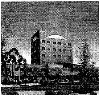
学術交流・生涯学習の拠点に、新しいまちづくりの中心に期待される同大学

国際社会で活躍し、地域文化の向上寄与できる人材育成を理念に平成六年の開校を目指している新潟国際情報大学(申請中)。その起工式が今