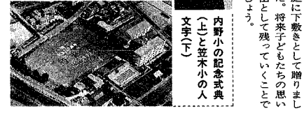
内野小の記念式典(上と笠木小の人文字)

今年七日、市内の豊原、松、地域の人やPTAが中心となり、二十周年を祝う記念式典が行われました。今年、百二十周年を迎える小学校は十九校。明治五年に小学校、中学校、明治五年に小学校、中学校、