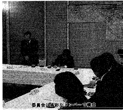
委員会（左から）新大教授、市長、委員、新大教授

環日本海圏の拠点都市である新潟市において、「水の都・新潟」の歴史や風土に根ざりつつ、国際化の進展に対応できる新しい住まい方を提案するとともに、市民参加のもとで、良好な住まい（住宅と環境）をつくり上げていく。