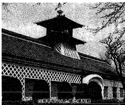
20周年を記念した郷土資料館

山からはもう雪の便りが聞こえて来る時期となりましたが、石山の園芸センターでは今が秋の真っ盛り。モミジ、ナナカマド、ヤマボウシ、ハナズキなどが見事に紅葉して見ごろを迎えています。また、ナナカマドやカズミは赤い実を枝に付けて、ひとまわり色鮮やかなオナガヤツギ、メジロなどの野鳥が実をついばみに訪れ、木々の間からは楽しい鳴き声が降り注いでいます。穏やかな秋の一日、園芸センターを訪れた親子づれは、行方秋を惜しむかのように、ゆつくりと園内を見て回っていました。 ※写真Ⅱ このほか、同センターの温室内ではストック、キンギョ草、ミニクラメンなどが咲き誇っています。どうぞご来場ください。