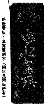
館屋看板・良寛書刻字(柴垣良策氏所蔵)

れ変わりました。旧新潟県庁舎は、日本がアメリカ、オランダなど五カ国との修好通商条約に基づき、新潟、横浜、函館、長崎、神戸の五港を開港するため、明治元年(一八六八)年の新潟開港の翌一年に新潟運上所として建てられました。それが明治六年に新潟税関と改められ、昭和四一年までの約百年間、税関業務を行ってきたものです。この建築物は五港の中で唯一現存するもので、擬洋風建築で建てられています。これは従来の和風建築に、新潟の大工が見ようみまわで洋風建築を取り入れたもの。建物の随所に日本様式が見られます。郷土資料館では、江戸時代から発達してきた新潟の町の様子を紹介しているのはじ